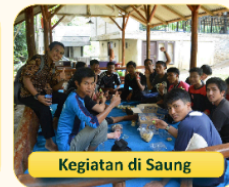
Kegiatan di Saung