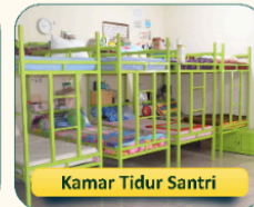
Kamar Tidur Santri