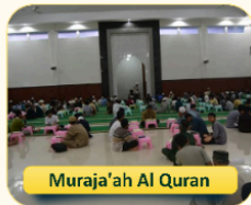
Muraja'ah Al Quran