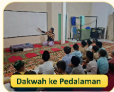
Dakwah ke Pedalaman