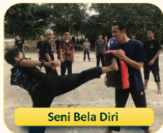
Seni Bela Diri