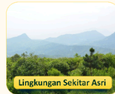
Lingkungan Sekitar Asri