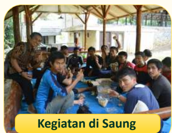
Kegiatan di Saung