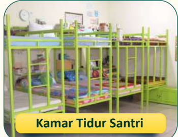
Kamar Tidur Santri