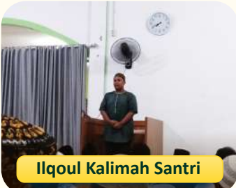
Ilqoul Kalimah Santri