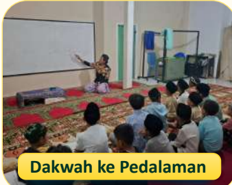
Dakwah ke Pedalaman